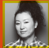
明星真由美 虎御前(十郎祐成の嫁と 称するお嬢)