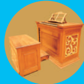
①ロビー コンサート