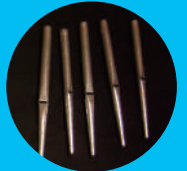
③オルガンの パイプを展示