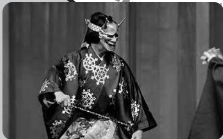
能「安達原」