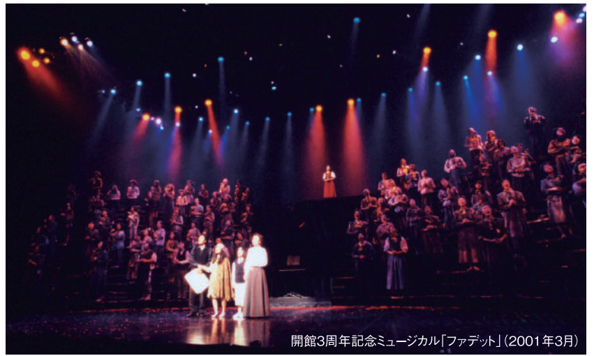
開館3周年記念ミュージカル「ファデット」(2001年3月)

新潟市民芸術文化会館 〒951-8132 新潟市中央区一番堀通町3番地2 (白山公園内) http://www.ryutopia.or.jp