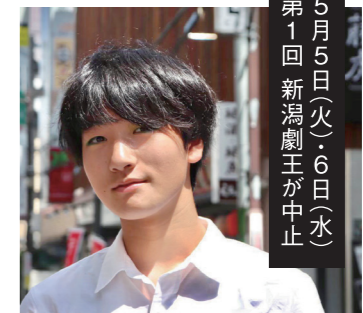
5月5日(火)・6日(水) 第1回新潟劇王が中止

コロナによって稽古ができず、日常の有り難みを実感する日々です。新潟劇王に向けて動き始めた矢先の中止発表は残念でしたが、またリ्यूーとびあに集まれる日常に帰ってくるため。そして医療従事者の皆様の次は創作者の番。人が免疫を得る様に、教訓を次へ伝える為の現代版「ベスト」を創らねばと思います。