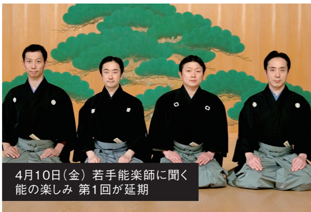
4月10日(金) 若手能楽師に聞く 能の楽しみ 第1回が延期

これも必要な充電期間と考え、安全が戻った後、よりよい舞台がお届けできますよう、稽古に励んでおります。ともに笑顔になれる舞台を心待ちにしております！