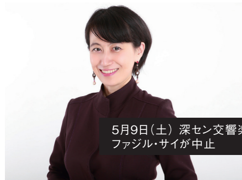
5月9日(土) 深セン交響楽団 & ファジル・サイが中止