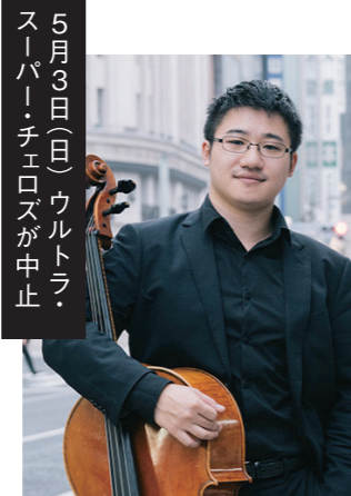
5月3日(日)ウルトラ・ スーパー・チェロズが中止