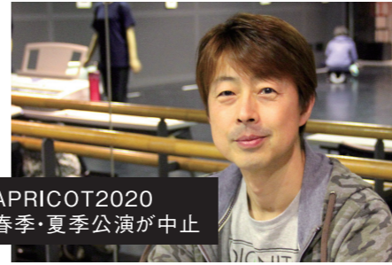
APRICOT2020 春季・夏季公演が中止