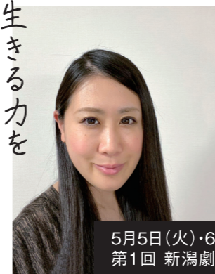
5月5日(火)・6日(水) 第1回 新潟劇王が中止

今は力を蓄える時です。世界中でこの状況を打破すべく、命を懸けて戦っている人たちがいます。私たち演劇人の役割は、今は「しない」を選ぶこと。人が集い、息、温度を感じるからこそ、生きる力を湧き立たせる力が演劇にはあります。「その時」を待って、「その時」にお会いしましょう!