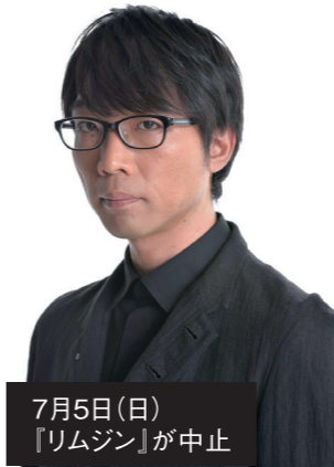
7月5日(日) 『リムジン』が中止