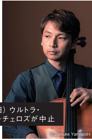
5月3日(日) ウルトラ・ スーパー・チェロズが中止