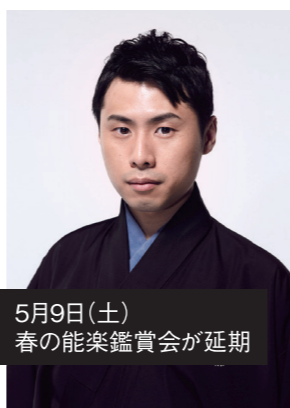
5月9日(土) 春の能楽鑑賞会が延期

この度のコロナ禍は、人々に大きな打撃を与えました。自由を奪われ、猜疑心に苛まれ、経済だけでなく心のゆとりをも失い、我々能楽師も皆辛い環境に置かれております。然し乍ら、過去を見れば危機に不死鳥の如く復活を遂げた先人に習い、苦境を工夫によって乗り越えることで革新が起る萌芽ともなります。発信の場としての貴館の存在は重要になる事は間違いございません。次代を望み、共に歩いて参りましょう。