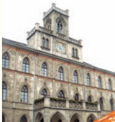
①ワイマール市庁舎