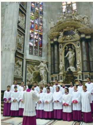
ミラノ大聖堂聖歌隊

ヨーロッパで最も古い伝統を誇る、14世紀創設の聖歌隊の初来日公演。グレゴリオ聖歌の源流、アンブロジーオ聖歌の響きを聴く貴重なコンサートです。モーツァルトほか、クリスマス・プログラムも合わせてお楽しみください。