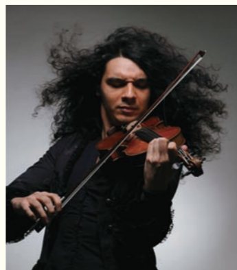
ネマニャ・ラドウロヴィチ

2012年11月、第75回新潟東響定期演奏会にヴァイオリニスト兼指揮者で登場し新潟の観客を魅了したネマニャ。目と心を一身に惹き付けてやまないカリスマ性はただものではない。大喝采から2年、ついにリサイタルが実現。モーツァルト&フランク&ラヴェルの名曲を奏でます。甘美とスリルが交錯する「ネマニャの世界」をどうぞお楽しみください。