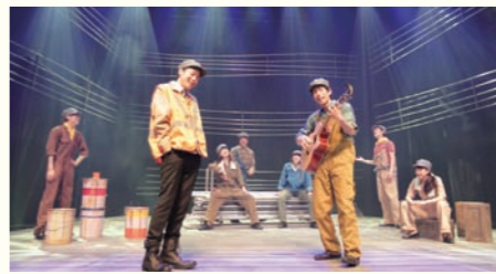
キャラメルボックス「無伴奏ソナタ」2012年初演

昨年的好评を受けて、2年連続の新潟公演が決定!「人が人を想う気持ち」をテーマに、「誰が観ても楽しめる」エンターテインメント作品を創り続けるキャラメルボックス。今回は、アメリカを代表するSF作家オースン・スコット・カードの「無伴奏ソナタ」を舞台化。壮絶な人生を生き抜いた一人の男を描いた感動作をお贈りします。