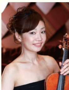
磯絵里子(ヴァイオリン)