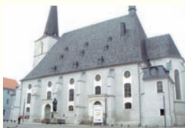
②画家クラナハの祭壇画がある ヘルダー協会