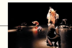
前回公演「DOVE」(演出・振付:山田勇気)より