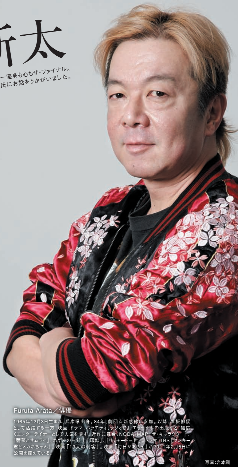
Furuta Arata / 俳優

1965年12月3日生まれ。兵庫県出身。84年、劇団☆新感線に参加。以降、看板俳優として活躍する一方、映画、ドラマ、バラエティ、ラジオD、エンセイ本の出版など、幅広くエンターテイナーとして人気を博す。近作に舞台、NODA・MAP「ザ・キャクター」、『薔薇とサムライ』、おずみの三銃士「印獣」、「リチャード三世」、ドラマ「TBS『ヤンキー君とメガネちゃん』」、映画「13人の刺客」。映画『毎日かあさん』が2011年2月5日に公開を控えている。