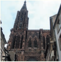
大聖堂と木組みの家