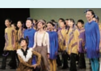
「名犬ラッシー」2013年公演

『大切なものは、目には見えない』—世界中で愛されている名作、サンテグジュペリの「星の王子さま」にAPRICOTが挑戦します。小さな星に住んでいた王子さまの「愛すること」に出逢う不思議な旅を、子どもたちが素直な心で描きます。音楽、美術、演出ともに今までにないスケールで創り上げる感動のステージをぜひご家族でお楽しみください。