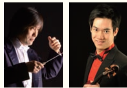
飯森範親(指揮) リチャードリン(ヴァイオリン)

第5回仙台国際音楽コンクールのヴァイオリン部門で優勝した新進気鋭のヴァイオリニスト、リチャード・リンによる、バルトークのヴァイオリン協奏曲。ペルリオーズの傑作、幻想交響曲は、2000年の第5回新潟定期演奏会で飯森が取り上げた演目。14年ぶりに聴く飯森&東響による情熱あふれる演奏をお楽しみください。