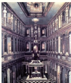
①ワイマールの宮廷教会。