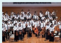
新潟市ジュニアオーケストラ教室

3月の「スプリングコンサート」、4月の「ラ・フォル・ジュルネ新潟2014」と立て続けに素晴らしい演奏を聴かせてくれたB合奏が、次に取り組むのは「ドヴォ8」。憧れの交響曲にメンバーは大張り切りですが、実際に練習してみるとなかなか手強い様子。今まで積み重ねてきたものを総動員し、ジュニオケらしい感動を伝えてくれることでしょう。ご期待ください。