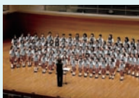
新潟市ジュニア合唱団

小学2年生から高校3年生まで、総勢約110名の団員が、この1年間の練習の成果を披露する特別な演奏会。りゅーとびあ専属オルガニスト山本真希と共演する、ベルゴレージの「スターバ・マーテル」、日本中が熱狂した1966年のビートルズ初来日。彼らが見たであろうニッポンを、ジュニア合唱団版でお贈ります。そしてコンサートの最後を飾る恒例の合唱ミュージカルは「合唱団物語」。