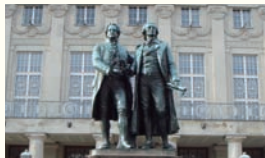
②国民劇場の前に立つゲテとシラー像。ワイマールでは多くの芸術家が活躍した。