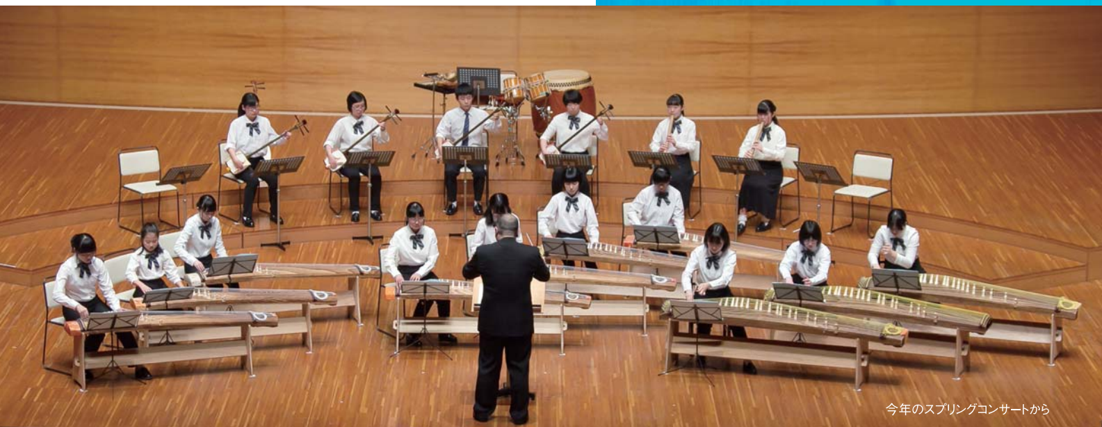
今年のスプリングコンサートから

NHK教育テレビ「にっぽんの芸能」や 新潟県文化祭への出演など、 ますます活躍の場を広げつつあるメンバーたち。 年に一度の定期演奏会は、 日々の積み重ねを最大限に発揮するべく、 身も心も緊張させて神経を研ぎ澄まし、 本番に臨みます。気迫のこもった演奏を聴きに、 ぜひ定期演奏会へお越しください！