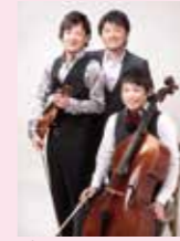
ザ・フレッシュメン

■5.12(金) ■11:30開演 ■コンサートホール ■出演:ザ・フレッシュメン(ピアノ三重奏)