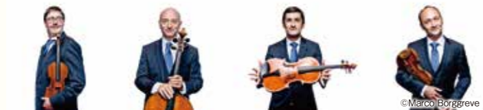
ダネル弦楽四重奏団

2005年以来2度目の新潟公演となるベルギーのカルテット。1991年ブリュッセルで結成。1993年サンクトペテルブルクのショスタコーヴィチ国際弦楽四重奏コンクール第1位。1994年ロンドン国際弦楽四重奏コンクールで第3位。1995年エヴィアン国際弦楽四重奏コンクールで第2位と、名だたるコンクールで優秀な成績をおさめ、結成直後から国際的な評価を得ています。古典から現代曲まで幅広いレパートリーを持つグループです。