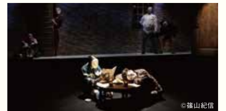
近代童話劇シリーズvol.2「マッチ売りの話」+「passacaglia」

アフタートーク冒頭、「皆さん頭の中がハテナ?だらけだと思いますが…」という穰さんの言葉に首を大きく縦に振った私。(無意識です・笑)