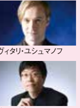
ヴィタリ・ユシュマノフ

■6.7(水) ■11:30開演 ■新潟市音楽文化会館 ホール ■出演:ヴィタリ・ユシュマノフ(バリトン) 山田剛史(ピアノ)