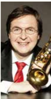
マティアス・ヘウス