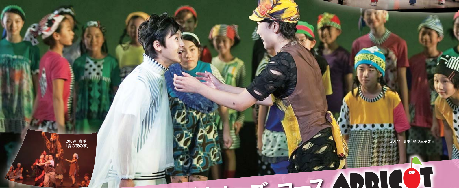
2009年春季 「夏の夜の夢」