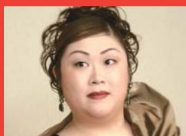
メゾソプラノ / 押見 朋子