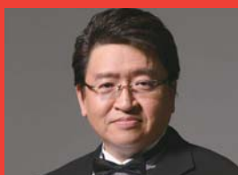
バリトン / 牧野 正人