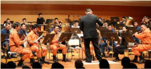
新潟市消防音楽隊