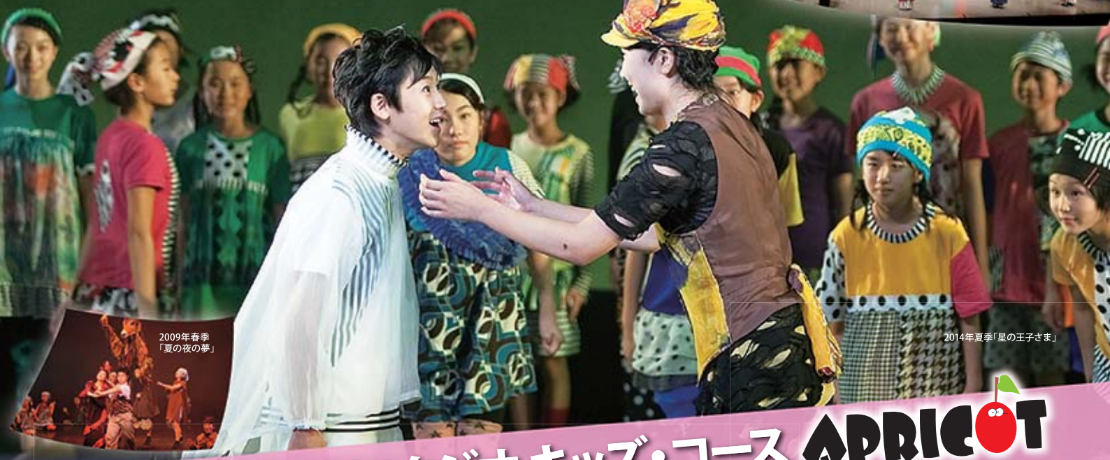
2009年春季 「夏の夜の夢」