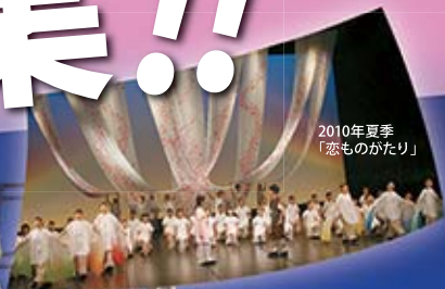
2010年夏季 「恋ものがたり」