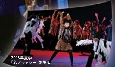
2013年夏季 「名犬ラッシー」劇場版