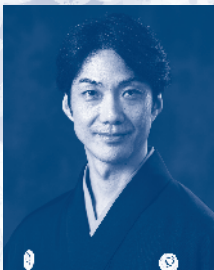
野村萬齋 (狂言方和泉流)