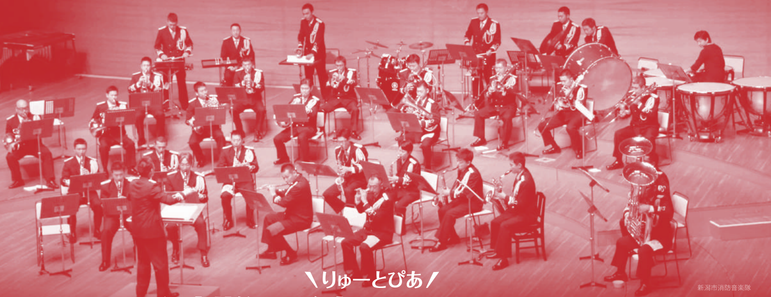
新潟市消防音楽隊