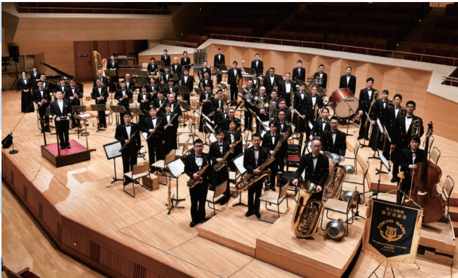
海上自衛隊東京音楽隊