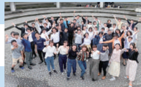
新潟大学合唱団(特別ゲスト)