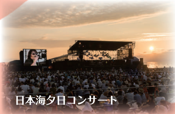
日本海夕日コンサート