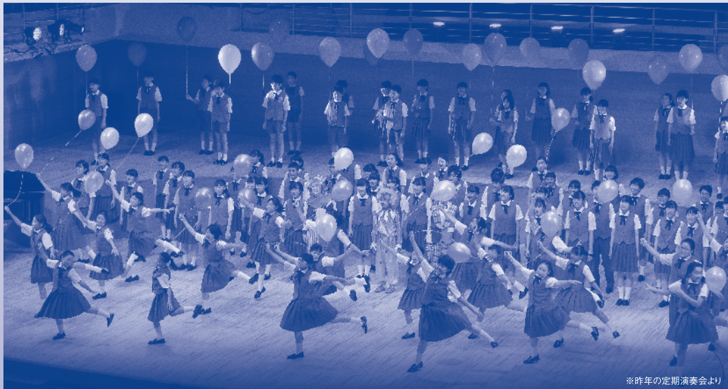
※昨年の定期演奏会より

小さい頃から友達と遊んだり、「また明日ね!」と別れを惜しんだり、休日になると家族とのんびり散歩に行ったり…。公園はたくさんの思い出が詰まっています。また来たいと思う、なんだかほっとするところ。ジュニア合唱団で育った私たちにとって合唱団はまさにそんな素敵な場所です。たくさんの伝統、思い出を残してくださった歴代の卒団生がいらしたからこそ今のジュニア合唱団があります。第二部のステージでは卒団生と現役団員との共演もお楽しみください。今年も新潟市ジュニア合唱団にしか出来ないステージをお届けいたします。是非ご来場ください!!