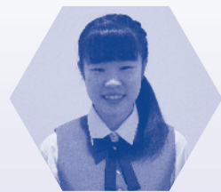
新潟市ジュニア合唱団団長