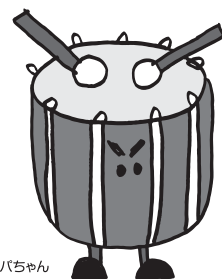
おティンパちゃん