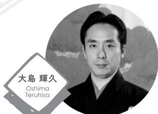
大島 輝久 Oshima Teruhisa

歌人。1970年生。馬場あき子に師事。 1991年角川短歌賞。2001年「若月祭」 で現代短歌新人賞。2012年「エク ス」で芸術選奨新人賞及び葛原妙子 賞。「あぢさるの夜」で短歌研究賞受 賞。現代歌人協会理事。