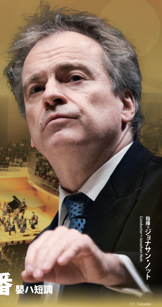
指揮=ジョナサン・ノット Conductor=Jonathan Nott