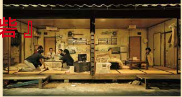
Niwa Gekidan Penino "Egao no Toride" (Fortress of Smile)

スタッフ 美術:カミイクタクヤ 照明:阿部将之(LICHT-ER) 音響:椎名晃嗣 演出助手:北方こだち 映像:松澤延拓 舞台監督:夏目雅也 舞台監督助手:小林勇陽・菊池遙 宣伝美術:山下浩介 制作:小野塚央