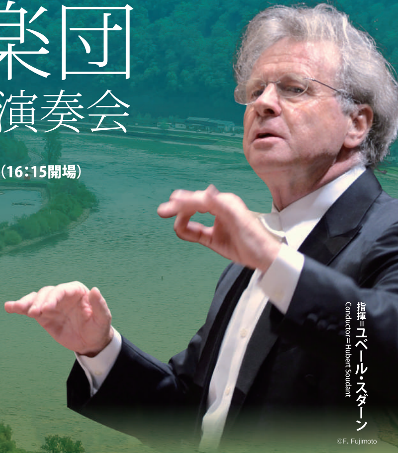
指揮=ユベール・スダーン Conductor=Hubert Soudant

2022年 11月6日 (日) 17:00開演 (16:15開場) りゅーとぴあ 新潟市民芸術文化会館 コンサートホール