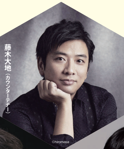
藤木大地 (カウンターテナー)

日本が世界に誇る 国際的カウンターテナーの 藤木大地と5人の名手による 珠玉の室内楽コンサート