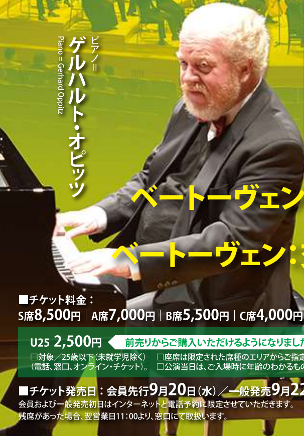
ピラノ=ゲルハルト・オピッツ Piano = Gerhard Oppitz