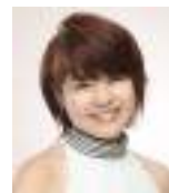
Viola 島田 玲 Shimada Rei

新潟市出身。桐朋女子高音楽科、桐朋学園大学を卒業。同研究科を修了。アムステルダム音楽院マスターコースを修了。日本クラシックコンクール全国大会第1位、東京音楽コンクール第1位、アムステルダムヴァイオリンコンクール第1位。現在、ロイヤル・コンセルトヘボウ管弦楽団ヴァイオリン副首席。また、GOYA QUARTET のメンバーとして、ヨーロッパ各地で演奏活動をしている。