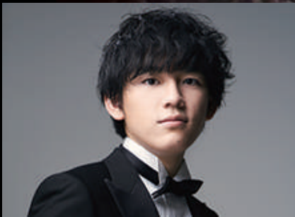
亀井聖矢 Kamei Masaya (ピアノ) ※

欧米を中心に活躍を続け、2021年東京交響楽団正指揮者に就任。サヴァンナ・フィルハーモニック音楽 & 芸術監督。米国シヨルティ財団キャリア支援賞6度、2023年には日本人で初めてトップのコンダクター賞受賞。第29回渡邊曉雄音楽基金音楽賞、第20回齋藤秀雄メモリアル基金賞受賞。 kharada.com/@KHconductor