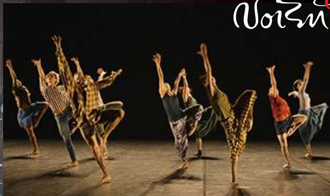
Noism Company Niigata (ノイズム) (舞踊) ※※※