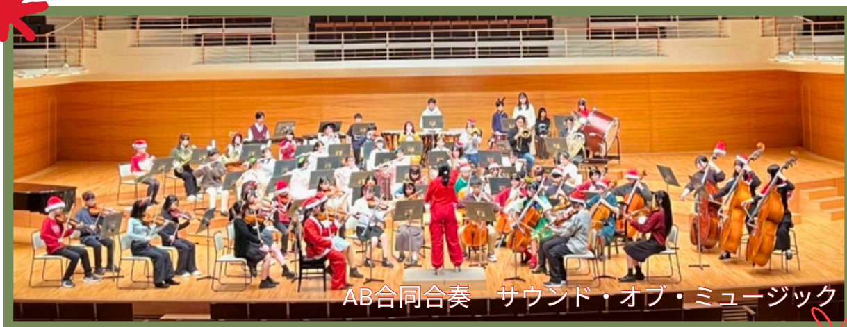
AB合同合奏 サウンド・オブ・ミュージック