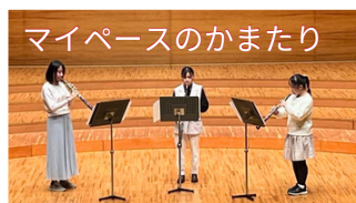
マイペースのかまたり