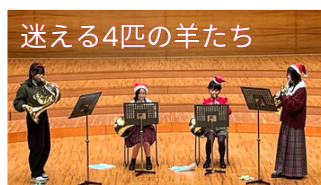
迷える4匹の羊たち